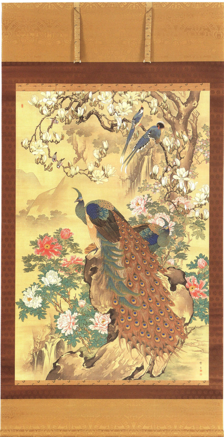
67—杉谷雪樵《花鳥之図》一幅 明治20年代(19世紀) 絹本着色 217.2×145.7